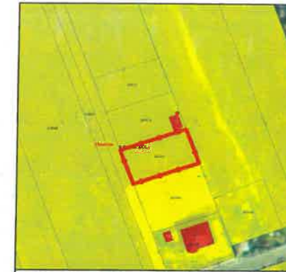
PLAN DE INCADRARE (Geoportal ANCP)

CRAIOVA, str. Plopului, nr. 15B, jud. Dolj